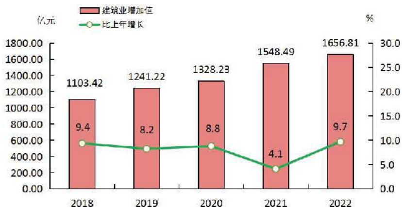
图 6 2018-2022 年建筑业增加值及其增长速度

全年全社会建筑业实现增加值 1656.81 亿元，比上年增长 9.7%。具有资质等级的总承包和专业承包建筑业企业完成建筑业总产值 6269.91 亿元，增长 7.9%。