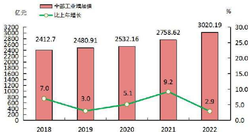
图 5 2018-2022 年全部工业增加值及其增长速度

全年全部工业增加值 3020.19 亿元,比上年增长 2.9%。规模以上工业增加值增长 3.8%。其中,轻工业下降 1.6%,重工业增长 8.9%;采矿业增长 11.0%,制造业增长 1.4%,电力、热力、燃气及水生产和供应业增长 31.9%。工业产品销售率 95.3%。