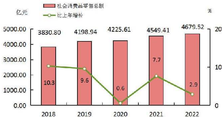
图 8 2018-2022 年社会消费品零售总额及其增长速度

全年社会消费品零售总额 4679.52 亿元，比上年增长 2.9%。在限额以上零售额中，按销售单位所在地统计，城镇消费品零售额 2812.85 亿元，增长 7.1%；乡村消费品零售额 165.42 亿元，下降 18.7%；按消费形态统计，商品零售额 2738.84 亿元，增长 5.5%；餐饮收入 239.43 亿元，增长 2.7%。