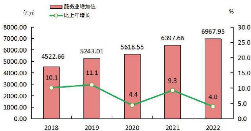
图 7 2018-2022 年服务业增加值及其增长速度

全年批发和零售业增加值 1506.51 亿元,比上年增长 6.9%;交通运输、仓储和邮政业增加值 509.75 亿元,增长 1.9%;住宿和餐饮业增加值 164.87 亿元,增长 0.9%;金融业增加值 1378.74 亿元,增长 11.0%;房地产业增加值 699.80 亿元,下降 6.6%。规模以上服务业企业营业收入比上年增长 0.6%。