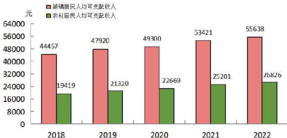
图 10 2018-2022 年居民人均可支配收入

全年居民人均生活消费支出 32299 元,比上年增长 4.6%。按常住地分,农村居民人均生活消费支出 21925 元,增长 4.9%;城镇居民人均生活消费支出 37181 元,增长 4.3%。