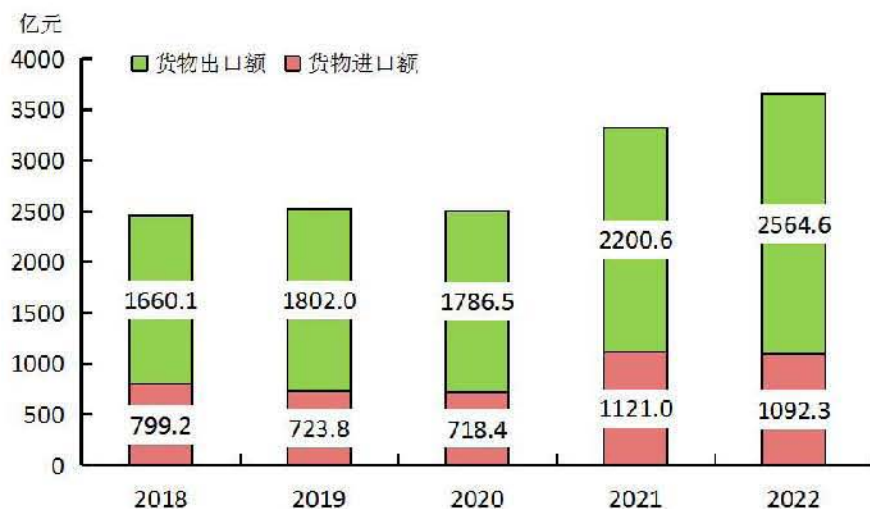
图 9 2018-2022 年货物进出口总额

全年进出口总额 3656.9 亿元，比上年增长 10.2%。其中，出口额 2564.6 亿元，增长 16.6%；进口额 1092.3 亿元，下降 2.4%。进出口顺差 1472.3 亿元。