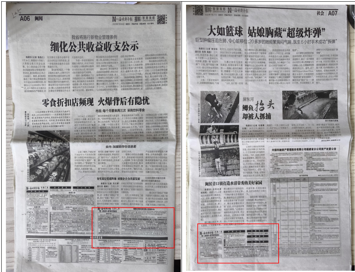
图4 二次报纸公示照片