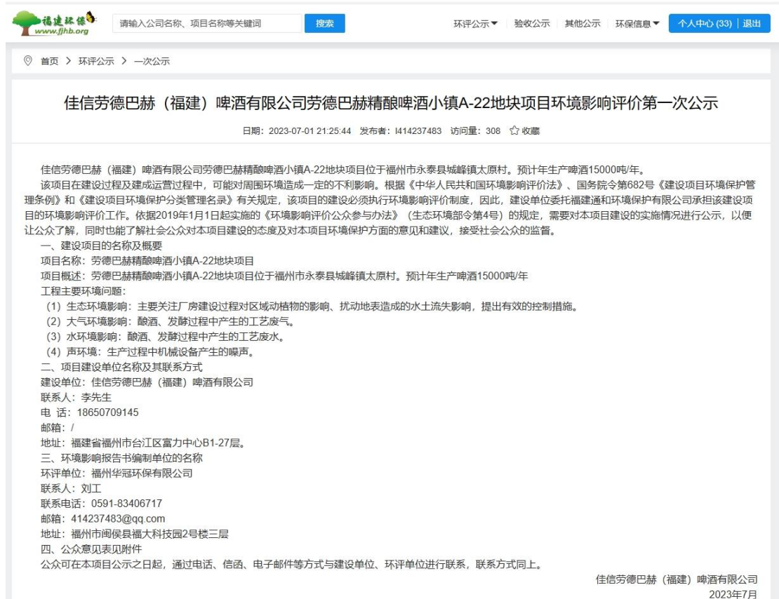
图 1 一次网络公示照片

佳信劳德巴赫（福建）啤酒有限公司于 2023 年 7 月 1 日在福建环保网进行一次网络公示。网络公示截图照片如图 1 所示。