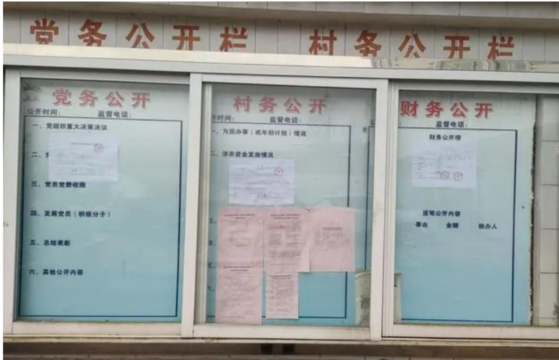
图5 二次现场（公示栏）公示照片

本公司于2023年7月25日~2023年8月8日在项目附近宣传栏上二次公示项目信息，公示期限为10个工作日。二次公告栏公示截图照片如图5所示。