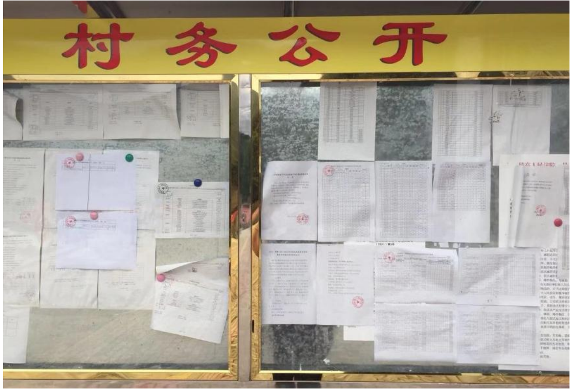
图 2 一次现场公示照片