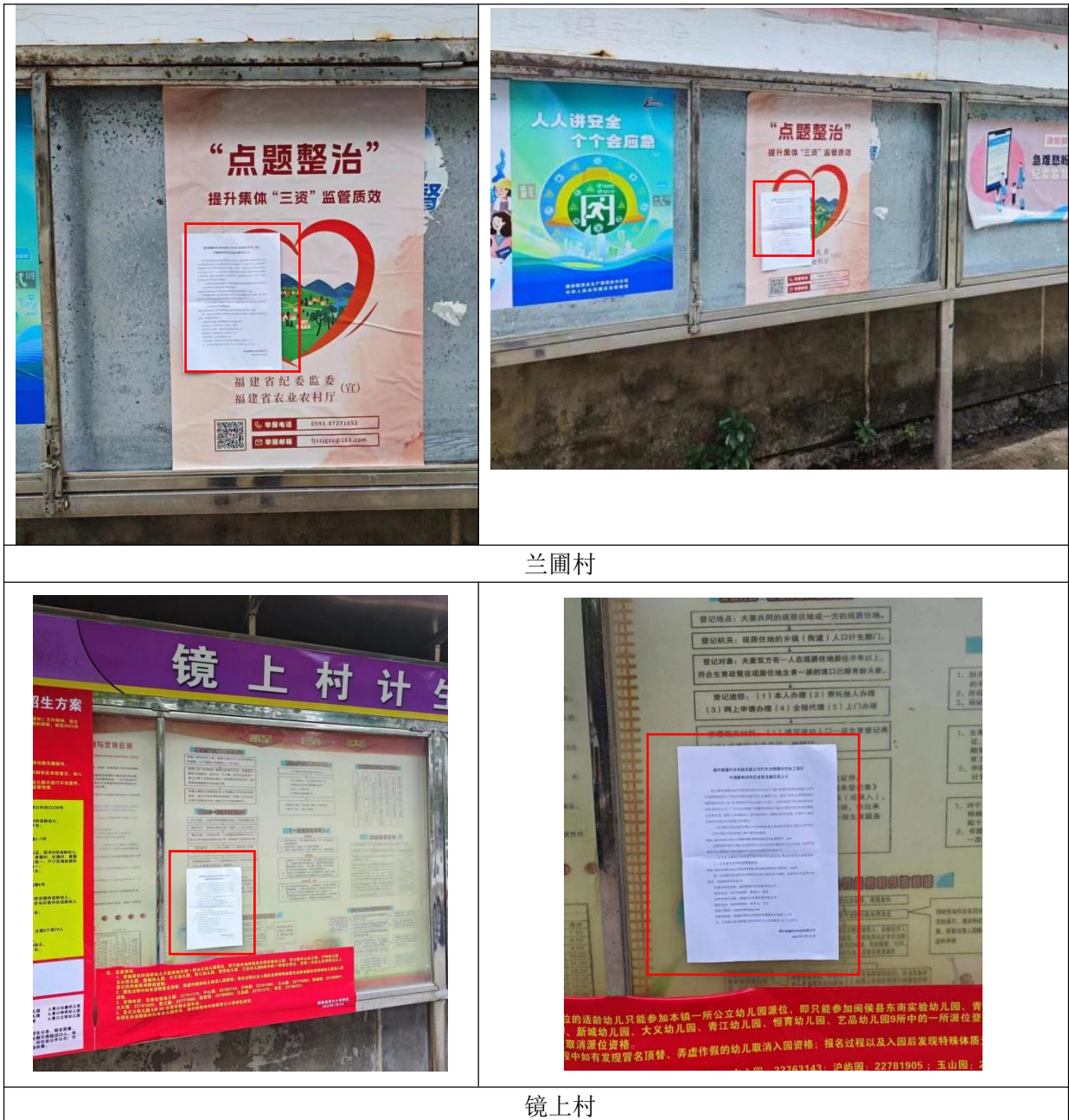
图 3.2-4 张贴公示

建设单位于 2023 年 9 月 15 日，选取与项目所在地有关的镜上村、兰圃村公告栏醒目位置张贴本项目征求意见稿公示信息，张贴公告现场照片详见图 3.2-4。